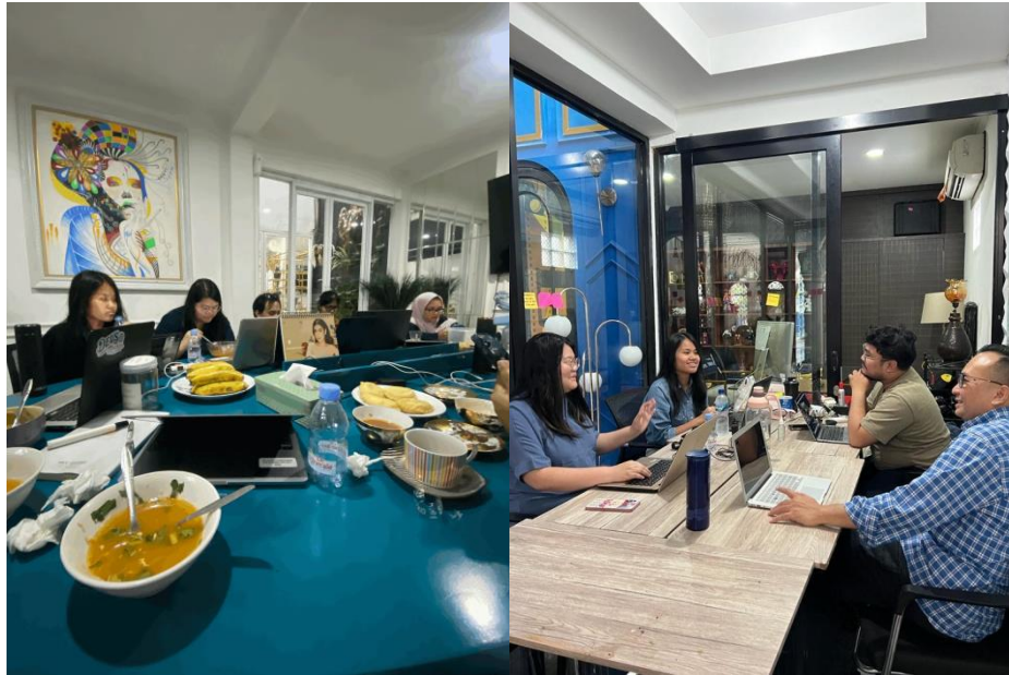
Gambar 3.3 Rapat dengan Tim Penulis Skenario dan