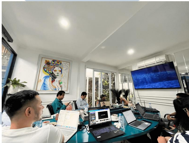
Gambar 3.2 Kegiatan Rapat pada Project Kiblat dengan Director

Karena sudah diputuskan jenis promo yang akan dibuat, maka head of creative dari Leo Pictures pun memberikan arahan kepada creative staff untuk membuat sinopsis dan juga skenario yang nantinya akan dibuatkan vertical short movie guna promo pada film Kiblat.