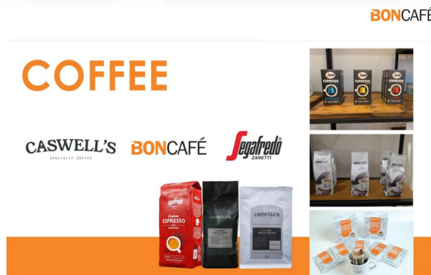
Gambar 2. 5 Coffee Brands

Dengan tiga merek kopi ternama yang dipasarkan, yaitu Boncafé, Caswell's Coffee, dan Segafredo Zanetti, Boncafé Indonesia terus berinovasi dan berusaha menjadi mitra yang handal bagi para pelanggan dalam memenuhi kebutuhan kopi mereka.