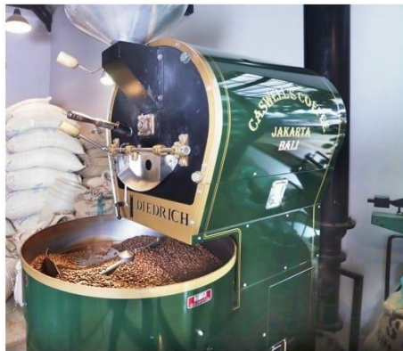
1986 Diedrich IR 12 Roaster

Capacity :Raw Input (8.3 Ton / Month) Roasted Output (7.7 Ton / Month)