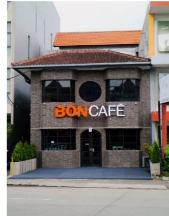
Jalan Sunset Road, Bangau 5 Bali