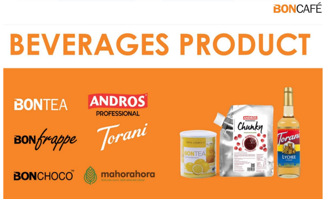
Gambar 2. 7 Beverages Brands

Kemudian, Boncafé juga menawarkan beverages product lainnya, seperti teh, coklat, frappe, Torani Syrup, Andros Professional, dan Mahorahora.