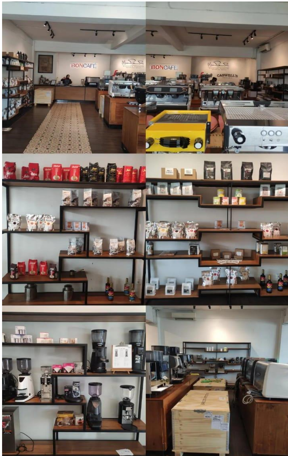
Gambar 2. 9 Showroom's Display yang berada di Lt. 1