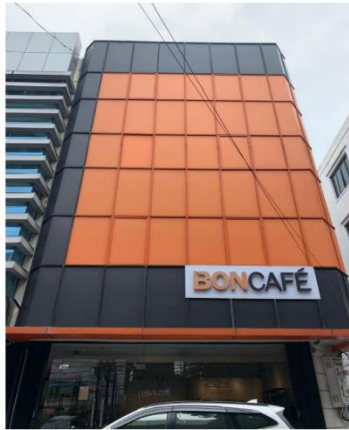
Jalan RS Fatmawati No. 15A Jakarta Selatan