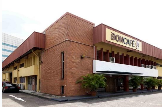
Gambar 2.2 Lokasi Boncafe International

tokoh terkemuka dalam industri minuman. Keanggotaan Boncafé International Pte Ltd dalam grup ini memberikan akses ke sumber daya dan jaringan yang kuat.