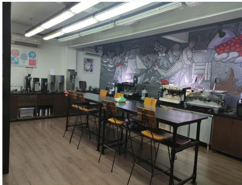
Gambar 2. 8 Caswell's Campus & Lab

National Coffee Judges, Regional and National Barista Champions, International Certified Trainers. Para peserta yang sudah menyelesaikan class program di Caswell's Campus, mayoritas telah menjadi coffee experts, coffee influencer, coffee judge, barista champions, dan coffee owner. Sehingga, dengan demikian juga memberi pengaruh pada perkembangan kopi di Indonesia. Program kelas yang terdapat di Caswell's Campus, yakni Barista Class, Advance Sensory Evaluation, Basic Cupping, Advance Brewing, dan Q Grader Course.