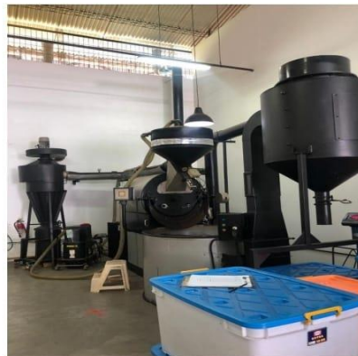
2006 Probat L50 Roaster

Capacity :Raw Input (19.25 Ton / Month) Roasted Output (16.2 Ton / Month)