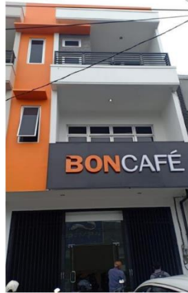
Jalan Magelang Km. 5,5 D.I.Yogyakarta