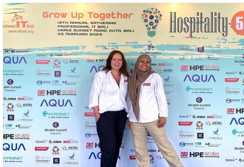
Gambar 2.4 Pakaian Kemeja PT Ruswin Indonesia