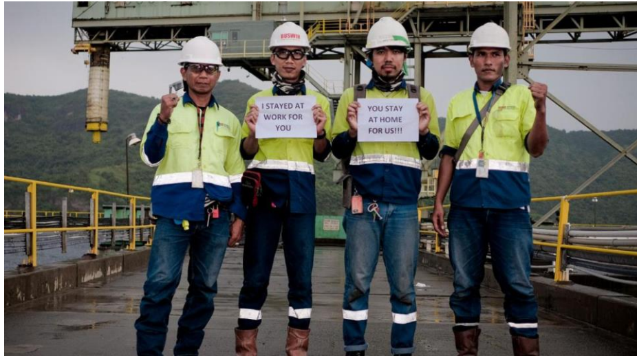
Gambar 2.5 Pakaian Lapangan Teknisi PT Ruswin Indonesia