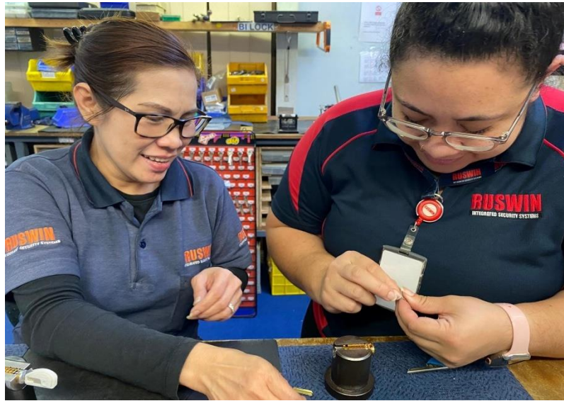
Gambar 2.3 Pakaian harian PT Ruswin Indonesia

Gambar 2.3 Melihatkan pakaian harian PT Ruswin Indonesia, gambar 2.4 melihatkan pakaian kemeja PT Ruswin Indonesia, gambar 2.5 melihatkan pakaian lapangan teknisi PT Ruswin Indonesia