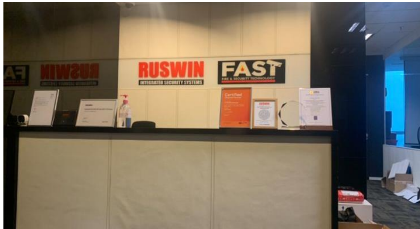
Gambar 2.1 PT Ruswin Indonesia