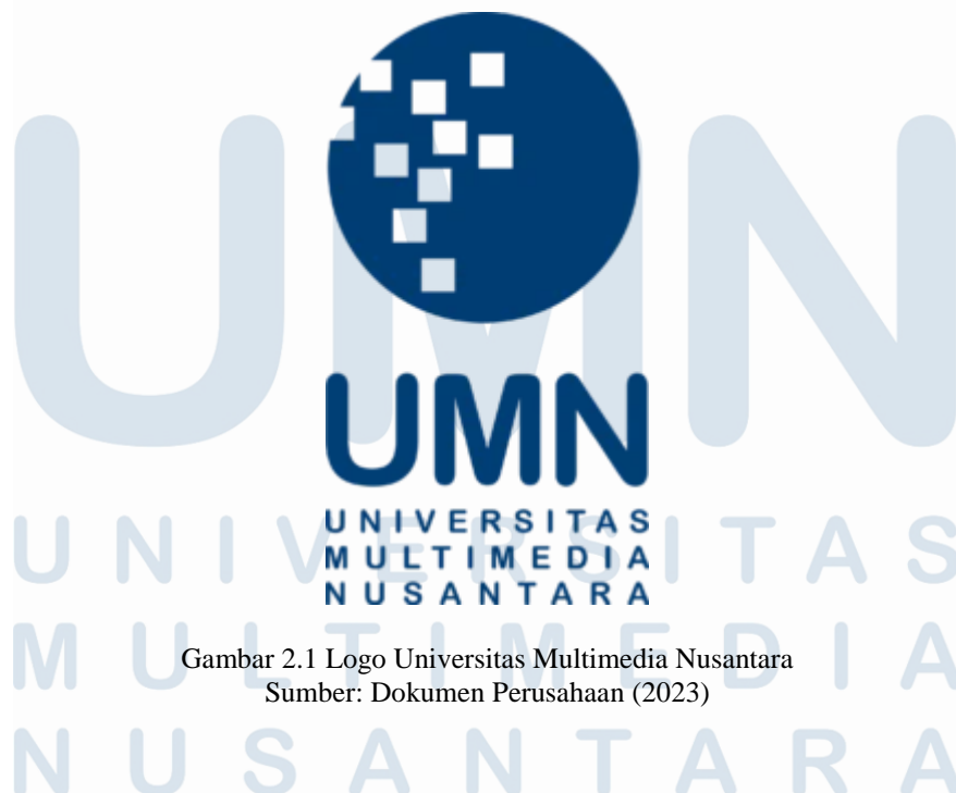
Gambar 2.1 Logo Universitas Multimedia Nusantara