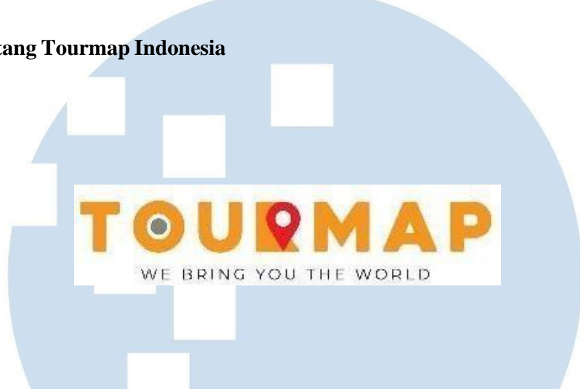
Gambar 2.1 Logo Perusahaan Tourmap Indonesia

Tourmap Indonesia merupakan perusahaan tour and travel yang di dirikan sejak tahun 2022. Tourmap Indonesia pada awalnya menyediakan jasa tour and travel ke Thailand dikarenakan banyaknya relasi di negara Thailand dan CEO yang sempat bertempat tinggal di Thailand. Namun seiring berjalannya waktu, Tourmap Indonesia mulai membuka dan menyediakan berbagai macam destinasi liburan untuk perjalanan domestik dan internasional. Melihat adanya banyak peminat yang menggunakan jasa tour dan travel kami, Tourmap Indonesia ingin membuat para traveler yang menggunakan jasanya semakin mudah untuk melakukan perjalanan, maka dari itu disediakan oleh Tourmap Indonesia jasa penyusunan dokumen liburan yaitu VISA dan Pasport sehingga klien tidak lagi sulit untuk mngurus dokumen.