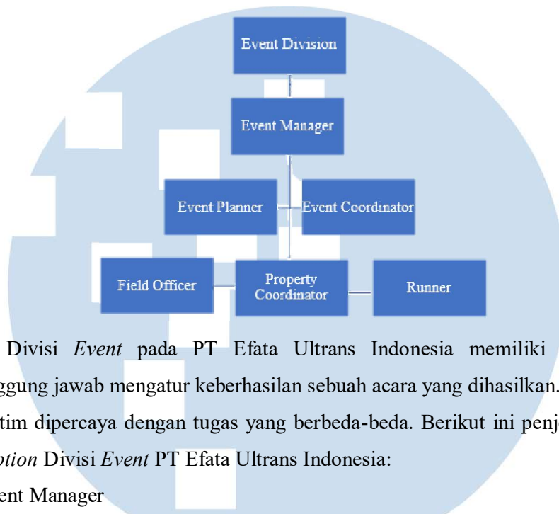
Tabel 2. 2 Struktur Event Division

Divisi Event pada PT Efata Ultrans Indonesia memiliki tim yang bertanggung jawab mengatur keberhasilan sebuah acara yang dihasilkan. Tentunya setiap tim dipercaya dengan tugas yang berbeda-beda. Berikut ini penjelasan job description Divisi Event PT Efata Ultrans Indonesia: