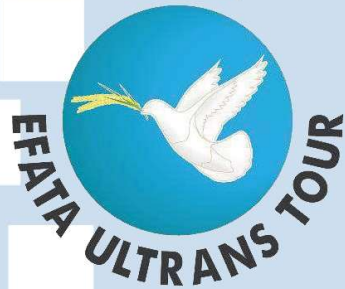
Gambar 2. Logo PT Efata Ultrans Indonesia

PT Efata Ultrans Indonesia atau bisa dikenal juga sebagai Efata Ultrans Tour and Travel Bali merupakan salah satu travel agent terdepan di Bali. PT Efata Ultrans Indonesia tidak hanya berfokus pada perjalanan turis ke luar negeri, tetapi juga menangani turis untuk mengunjungi Indonesia.