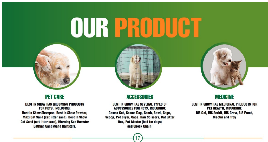
Gambar 2.2 Produk Best In Show