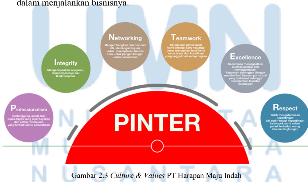
Gambar 2.3 Culture & Values PT Harapan Maju Indah

PT Harapan Maju Indah menerapkan 6 nilai penting yang menjadi dasar dalam menjalankan bisnisnya.