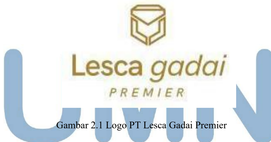
Gambar 2.1 Logo PT Lesca Gadai Premier

PT Lesca Gadai Premier, juga dikenal sebagai LGP, adalah perusahaan gadai berizin resmi dari OJK (Otoritas Jasa Keuangan). Lesca Gadai menawarkan pinjaman dana dengan menggunakan barang jaminan berupa jam tangan mewah, tas mewah, perhiasan emas dan berlian, logam mulia, dan mobil mewah. Lesca Gadai juga menawarkan layanan pinjaman konsumtif dengan menggunakan barang jaminan berupa jam tangan mewah, tas mewah, perhiasan emas dan berlian, dan logam mulia.