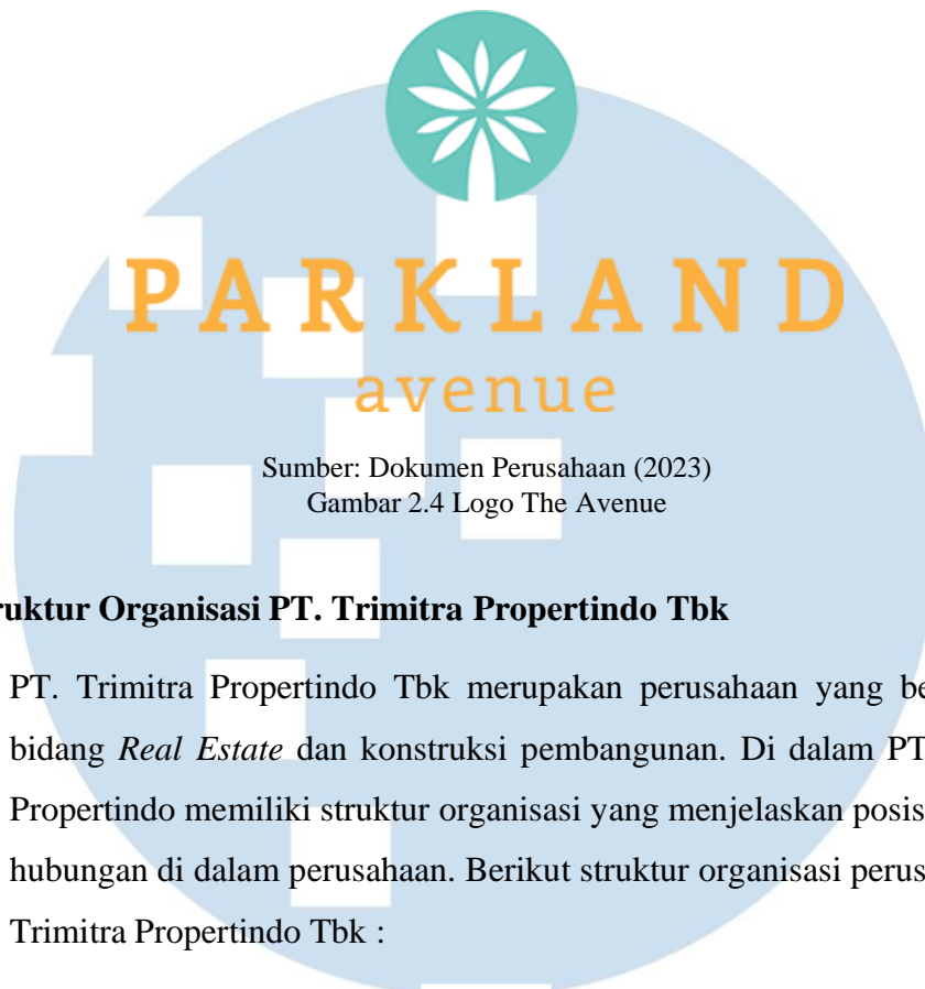
Gambar 2.4 Logo The Avenue