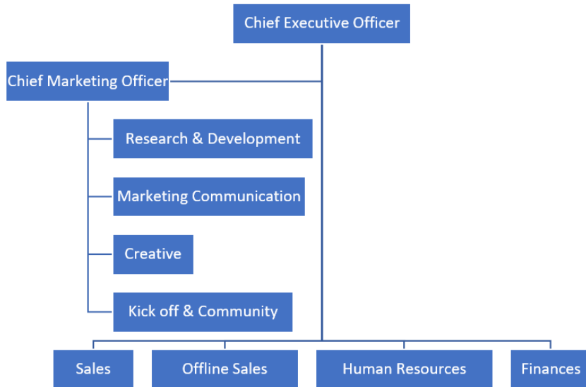
Gambar 2.2 Struktur Organisasi PT Jelita Anugerah Indonesia

PT Jelita Anugerah Indonesia atau brand Jacquelle Beaute merupakan perusahaan yang bergerak di industri kecantikan khususnya makeup dan sudah beroperasi sejak tahun 2015 ini memiliki struktur organisasi sebagai berikut