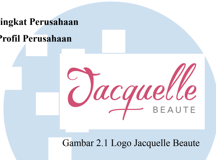
Gambar 2.1 Logo Jacquelle Beaute

Jacquelle Beaute adalah brand kecantikan Indonesia yang berdiri pada bulan Desember tahun 2015 dan terkenal dengan produk-produk yang serbaguna, unik, dan berkualitas tinggi, sejajar dengan brand-brand global. Jacquelle Beaute juga merupakan merek kecantikan Indonesia yang memiliki kolaborasi internasional yang paling banyak seperti dengan Sanrio, Nivea, Senka, Biore, Cetaphil, Disney, SPY X Family, dan lain sebagainya. Jacquelle Beaute memiliki janji pelayanan atau servicing yaitu “ giving the best customer service experience & caretaker of society through better quality products. ”