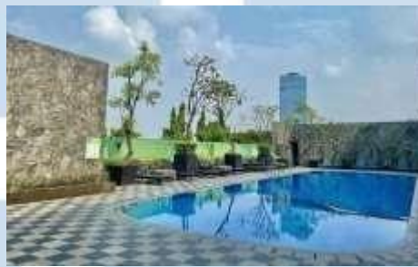
Gambar 2.1 Whiz Prime Hotel Kelapa Gading

Seiring dengan kemajuan teknologi dan transformasi perilaku masyarakat, PT Dunia Entertainment, melalui jaringan bisnisnya, khususnya Hotel Whiz Prime, merespons dinamika ini dengan memanfaatkan media sosial sebagai salah satu alat pemasaran utama. Dalam konteks visi, yang menegaskan tujuan menjadi jaringan hotel yang dicari dan berkembang pesat di Indonesia, pendekatan ini menjadi semakin penting.