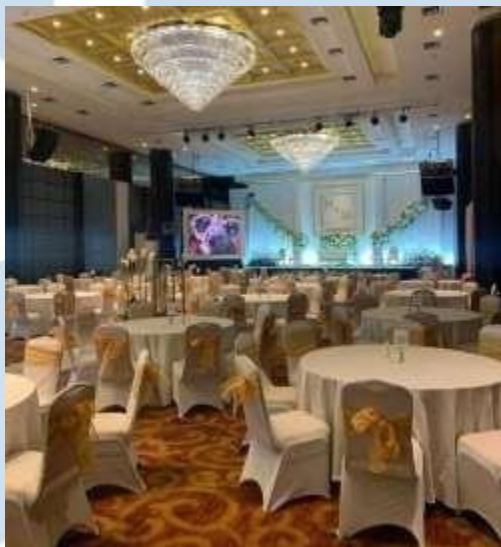
Gambar 2.3 Gading Grand Ballroom