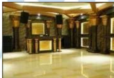
Gambar 2.6 Level 5 Karaoke