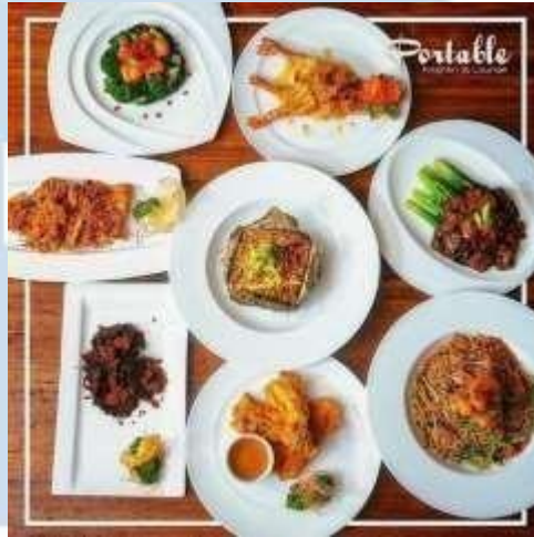
Gambar 2.2 Portable Kithcen & Lounge

Portable Kitchen & Lounge memiliki visi untuk menjadi destinasi kuliner terdepan yang mendominasi selera publik. Dengan komitmen kuat terhadap kualitas, restoran ini berusaha memberikan pengalaman kuliner unggul melalui menu berkualitas tinggi dan inovasi tanpa batas. Selain itu, Portable Kitchen & Lounge juga bermis i untuk terlibat dalam komunitas kuliner, mendukung inisiatif setempat, dan menjadi pusat pertemuan para pecinta makanan. Melalui fokus pada kesenangan dan kenangan, restoran ini bertujuan menciptakan momen berkesan bagi setiap pelanggan, menjadikannya tempat tak hanya untuk menyantap makanan lezat tetapi juga merayakan pengalaman kuliner yang unik. Dengan demikian, Portable Kitchen & Lounge berkomitmen untuk merajai selera dan memenuhi harapan pelanggan dalam setiap kunjungan.