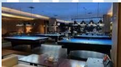
Gambar 2.5 Portable Billiard