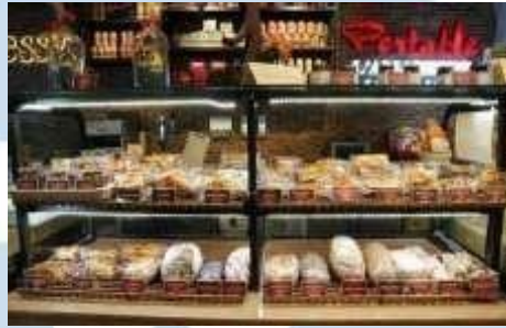
Gambar 2.4 L'amandine Patisserie

Visi : Menjadi Sumber Kesenangan dan Kebahagiaan Melalui Karya Patiseri yang Berkualitas Tinggi.