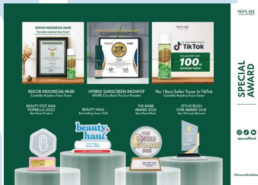
Gambar 2. 2 Penghargaan NPURE

Produk-produk PT. Penta Natural Kosmetindo (NPURE) juga sudah lolos standarisasi karena sudah Dermatologically Tested, Non-Toxic Ingredients, Safe for All Skin Type , dan yang terpenting adalah Pregnant and Breastfeeding Friendly dan sudah tersertifikasi HALAL dan BPOM. Dengan didasari standar tinggi, PT. Penta Natural Kosmetindo (NPURE) berhasil menciptakan produk berkualitas tinggi. Kesuksesan dalam membangun dan mengembangkan produknya, PT. Penta Natural Kosmetindo (NPURE) menerima berbagai penghargaan ternama yang semakin meningkatkan reputasinya sebagai brand skincare natural terbaik di Indonesia.