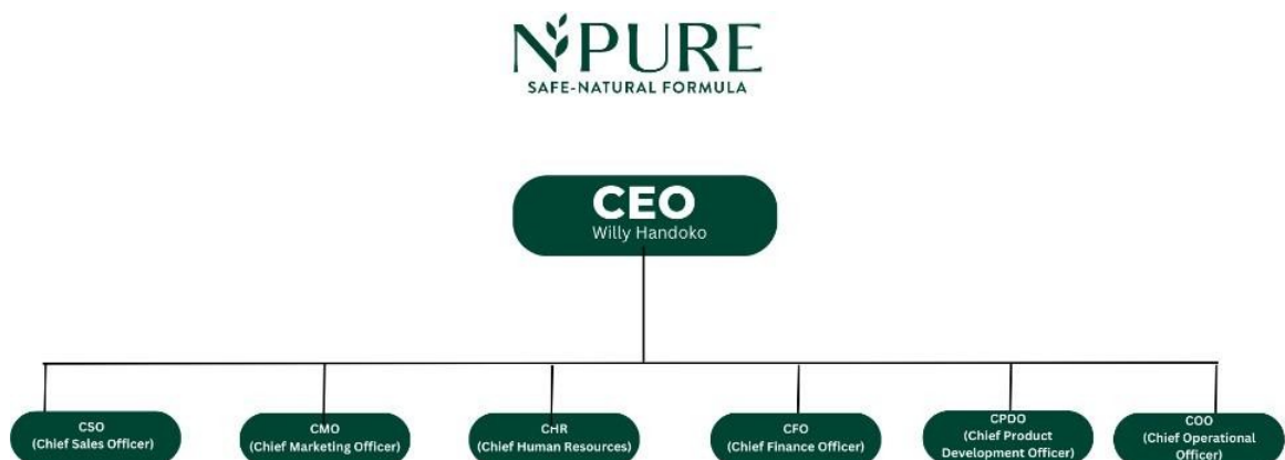
Gambar 2. 5 Struktur Perusahaan NPURE

Sebagai brand skincare yang telah beroperasi sejak tahun 2017, adapun struktur organisasi yang mengatur proses pelaksanaan kerja dari setiap divisi di perusahaan