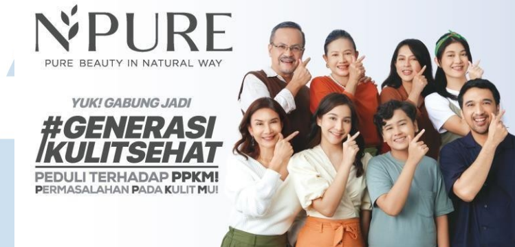
Gambar 2. 3 Campaign Generasi Kulit Sehat

orang berhak mendapatkan kulit sehat, baik pria maupun wanita; tak terkecuali yang masih muda dan sudah berusia, termasuk kulit orang Indonesia yang unik