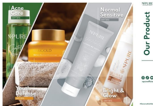
Gambar 2. 1 Rangkaian Series Skincare NPURE