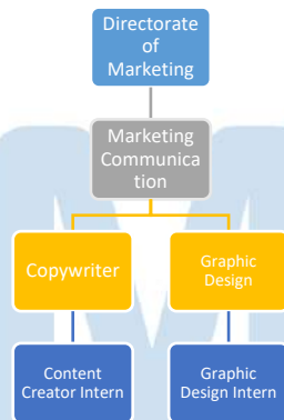
Gambar 2. 3 Struktur Departemen Marketing

PT Putra Windu Trijaya memiliki beberapa departemen, salah satunya adalah Departemen Marketing yang memiliki struktur organisasi sebagai berikut: