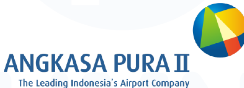
Gambar 2. 1 Logo PT Angkasa Pura II

Logo yang dimiliki oleh PT Angkasa Pura II sendiri memiliki arti yaitu “ Sky City ” atau dunia tanpa batas, lalu ada simbol yang menggambarkan bola dunia, bola dunia ini memiliki arti siapnya seluruh jajaran PT Angkasa Pura II agar bisa bersaing di era globalisasi dengan memiliki tekad yang kuat dan bulat untuk menyambut para pengguna jasa dengan memberikan pelayanan yang sempurna didukung dengan sistem kerja kelas satu yang berstandar internasional. Tulisan ANGKASA PURA II memberikan kesan kepada masyarakat bahwa kita memiliki pribadi yang kokoh dan bertanggung jawab dengan dukungan manajemen dan seluruh staf PT Angkasa Pura II. Brandline PT Angkasa Pura II memiliki makna sebagai Operator Bandar Udara terdepan yang mengelola 20 bandara di Indonesia dengan kurang lebih 100 juta pergerakan penumpang, dan diprediksi akan bertambah seiring waktu.