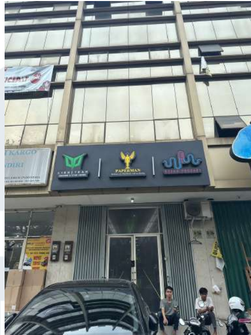
Gambar 2.3 Lokasi kantor PT Pangeran Persada Manunggal