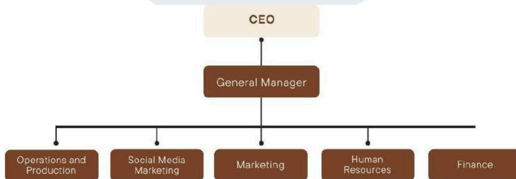
Gambar 2.4 Bagan Perusahaan Paperman Ads

PT Pangeran Persada Manunggal merupakan perusahaan yang masih cukup muda dalam bidangnya dan hanya memiliki bagan pekerja yang cukup kecil secara ukuran. Paperman Ads beroperasi di Indonesia sejak tahun 2018 meliputi layanan penuh periklanan dan memiliki struktur organisasi sebagai berikut: