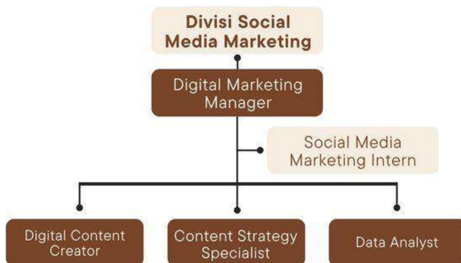
Gambar 2.5 Bagan Perusahaan Paperman Ads, Divisi Social Media Marketing

Divisi keuangan memiliki peran sentral dalam mengelola aspek keuangan perusahaan, termasuk perencanaan anggaran, pengelolaan kas, dan pelaporan keuangan. Tugasnya mencakup analisis keuangan, pemantauan arus kas, serta pengambilan keputusan strategis terkait investasi dan pembiayaan. Dengan mengelola secara efisien sumber daya keuangan, divisi ini mendukung stabilitas dan pertumbuhan jangka panjang perusahaan.