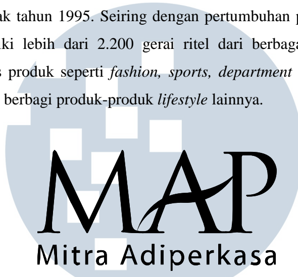
Gambar 2.1. Logo PT Mitra Adiperkasa

PT Mitra Adiperkasa, Tbk merupakan sebuah perusahaan ritel yang berdiri di Indonesia sejak tahun 1995. Seiring dengan pertumbuhan perusahaan, kini MAP sudah memiliki lebih dari 2.200 gerai ritel dari berbagai macam brand dari beragam jenis produk seperti fashion, sports, department stores, kids, food and beverage , dan berbagai produk-produk lifestyle lainnya.