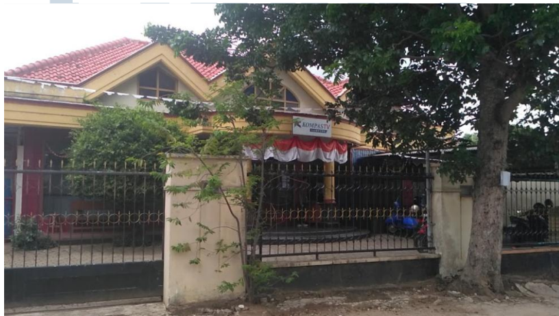
Gambar 2.3 Kantor Kompas TV Lampung