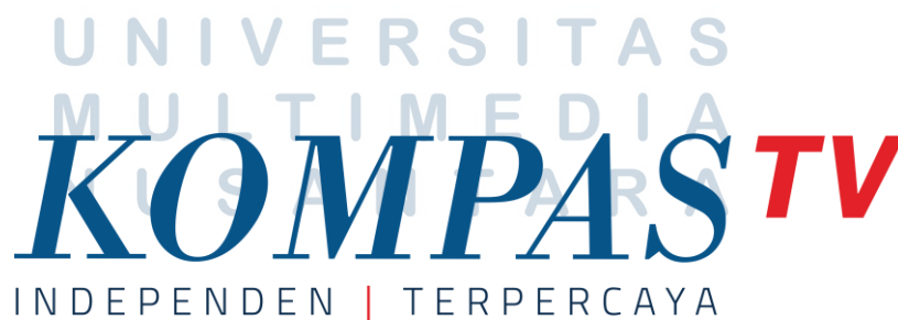
Gambar 2.1 Logo Kompas TV

Kompas TV Lampung cukup berpengalaman dalam menghadapi tekanan-tekanan saat menghadirkan fakta-fakta yang terjadi di daerah Lampung. Dengan slogan independen dan terpercaya Kompas TV Lampung dituntut harus dapat mengedepankan profesionalitas dalam menghadapi Narasumber. Tidak hanya memberikan berita di daerah lokal saja, Biro Kompas TV Lampung juga mendapat kesempatan untuk memberikan berita di kanal nasional yaitu lewat program berita Cerita Nusantara dua kali setiap bulannya. Program-program Kompas TV Lampung tidak hanya berita saja terdapat juga program hiburan yaitu: Program pertama Gerbang Lampung, program yang mengangkat potensi kesenian, kuliner dan wisata di provinsi Lampung dengan kehadiran program ini diharapkan masyarakat daerah Lampung dapat lebih mengenal kebudayaan daerahnya. Program kedua adalah Indie Lampung, program ini menayangkan film-film pendek karya anak SMK di sekitar Lampung dengan seleksi-seleksi yang dilakukan sebelumnya. Seleksi dilakukan untuk menghindari konten kekerasan yang ada di dalam film. Pada perjalanannya program Indie Lampung sedang memasuki masa vakum dikarenakan kurangnya tenaga kerja yang menangani program ini.