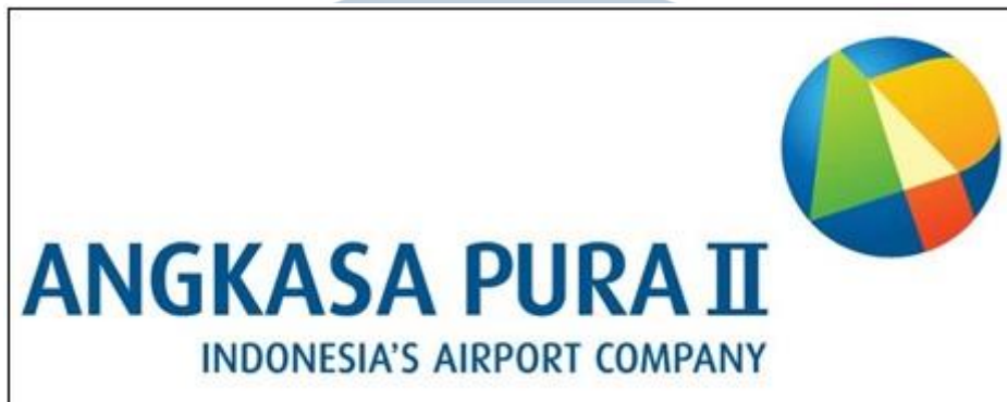
Gambar 2.1 Logo PT Angkasa Pura II (Persero)

Setiap logo memiliki arti dibalik konsep pembuatannya, tak terkecuali logo PT Angkasa Pura II (Persero). Gambar 2.1 adalah logo PT Angkasa Pura II (Persero) yang didapatkan dari situs resmi PT Angkasa Pura II (Persero). Biru adalah warna yang melambangkan pergerakan sektor logistik yang terus tumbuh berkembang pesat. Warna merah melambangkan tindakan yang berlandaskan semangat kerja dan komitmen PT Angkasa Pura II dalam menyediakan pelayanan berkualitas internasional dengan mengutamakan kenyamanan dan keselamatan pelanggan. Kuning melambangkan kemakmuran sebagai buah keberhasilan yang akan didapat dari kerja keras PT Angkasa Pura II untuk para pemegang saham, manajemen, karyawan, dan Indonesia. Hijau melambangkan arah kepemimpinan yang tegas, berintegritas, dan terarah menuju pertumbuhan perusahaan yang sehat.