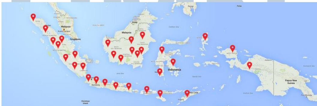
Gambar 2. 3 Wilayah Jangkauan Alfacart

Alfacart.com adalah e-commerce dukungan jaringan terbesar, terintegrasi dengan toko Alfamart se-Indonesia yang memungkinkan semua kalangan dari kota besar hingga pelosok untuk menikmati kemudahan berbelanja online. Berikut wilayah jangkauan layanan Alfacart dapat dilihat pada Gambar 2.3: