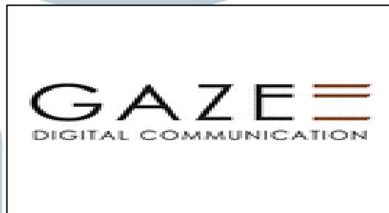
Gambar 2.1 Logo PT Gaze