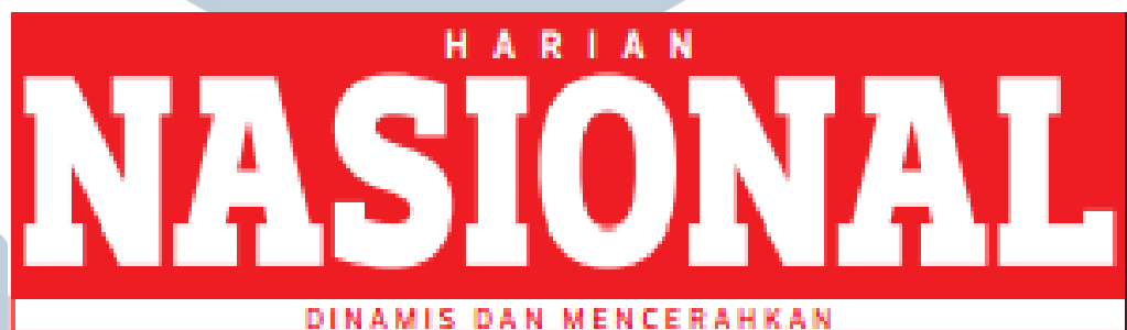
Gambar 2.1 Logo Harian Nasional