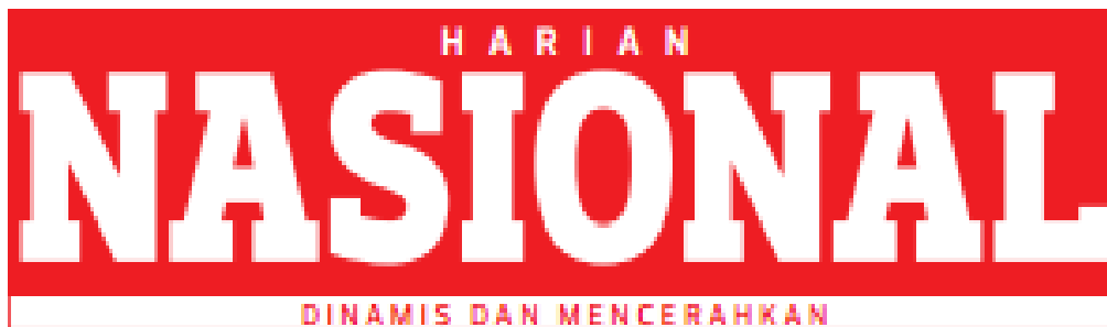
Gambar 2.1 Logo Harian Nasional