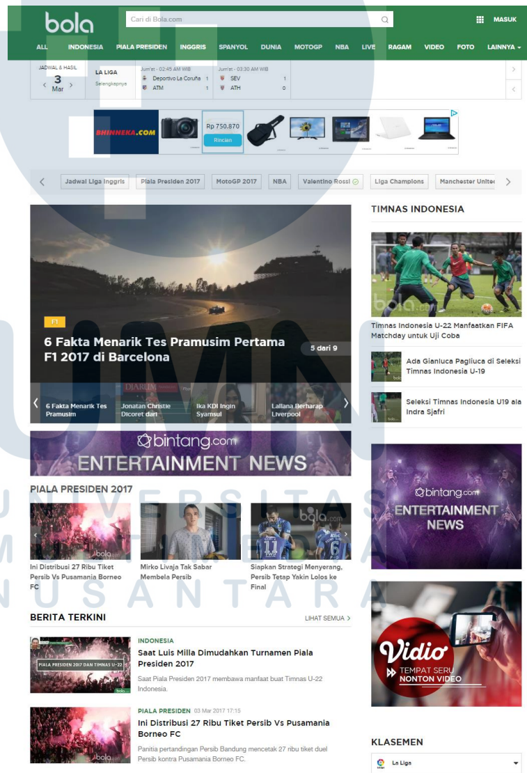
Tampilan Website Bola.com