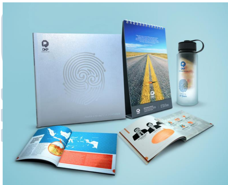
Gambar 2.5 DKP

DKP adalah perusahaan yang bergerak dalam bidang teknologi Auto ID dan Data Capture. Duta Kalingga Pratama sudah berdiri sejak tahun 1987. Dalam proyek kali ini DKP berulang tahun yang ke 30 tahun, sehingga ingin mengeluarkan berbagai brosur, merchandise, dan kalender yang baru bertema 30 th anniversary.