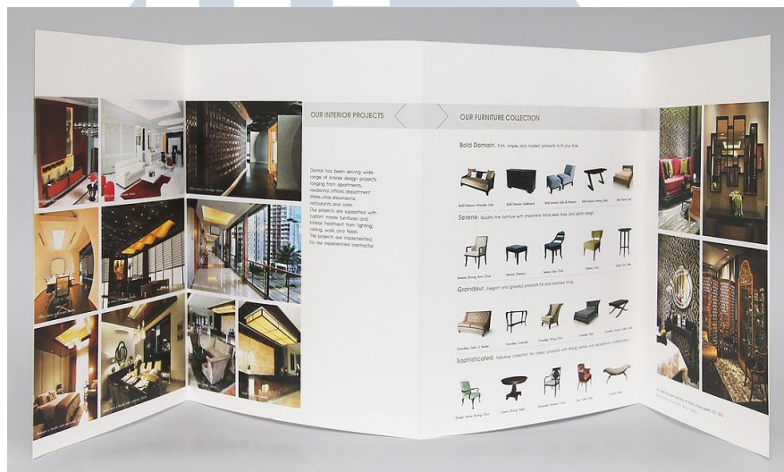
Gambar 2.6. Portofolio Nucleus Branding and Communication

Damar awalnya berdiri dari tim desainer interior yang berbakat. Damar adalah salah satu perusahaan interior yang terdepan di Indonesia. Hasil interior Damar berkisar dari model klasik, modern, dan sentuhan budaya lokal. Damar juga berkolaborasi dengan arsitek lainnya agar desain interior yang dihasilkan lebih baik dan lebih dari standar yang ada.