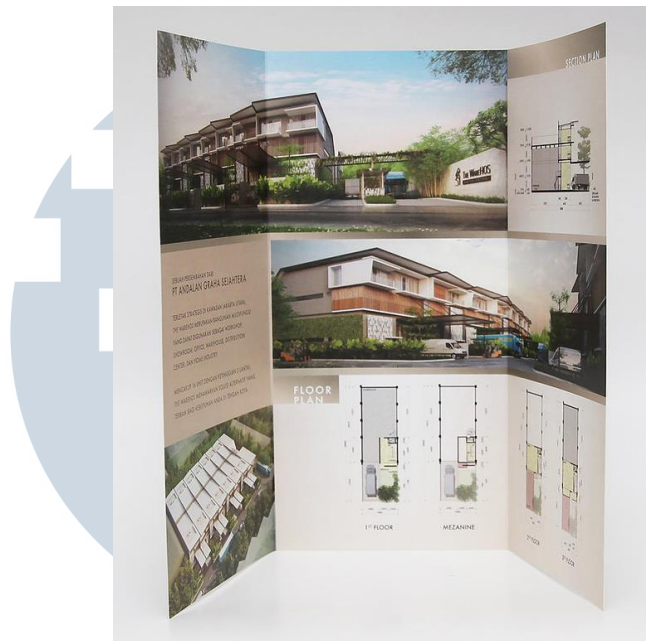
Gambar 2.3. The WareHOS