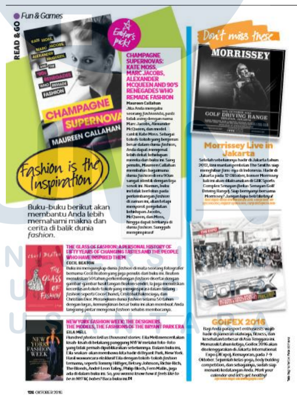
Gambar 3.3. Read & Go

Contoh artikel penulis yang menggunakan pengumpulan data melalui dokumen publik adalah rubrik “ Read and Go ”. Dalam proses penulisan artikel yang dimuat di majalah CLEO Indonesia ini, penulis hanya mengambil data dari dokumen publik seperti sampel buku dan dokumen-dokumen pihak penyelenggara acara (Contoh lihat pada gambar 3.3).