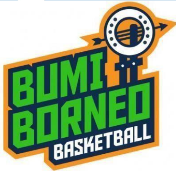
Gambar 2. 1 Logo Perusahaan

PT Gelora Bumi Khatulistiwa merupakan salah satu perusahaan yang berdiri sejak tahun 2020. PT Gelora Bumi Khatulistiwa merupakan perusahaan yang bergerak di bidang sport dan entertainment . PT Gelora Bumi Khatulistiwa menaungi perusahaan Bumi Borneo yang memiliki komitmen untuk memberikan pelayanan pada bidang pemasaran khususnya creative media dengan menjalin kerjasama dengan berbagai sponsorship .