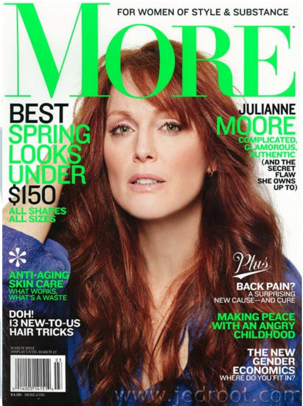
Gambar 2.3 Cover Majalah MORE United States