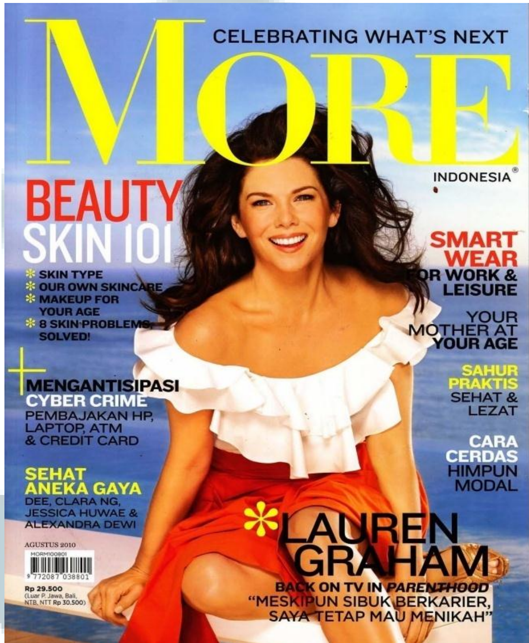
Gambar 2.1 Cover Majalah MORE Indonesia edisi pertama kali terbit di Indonesia Bulan Agustus 2010