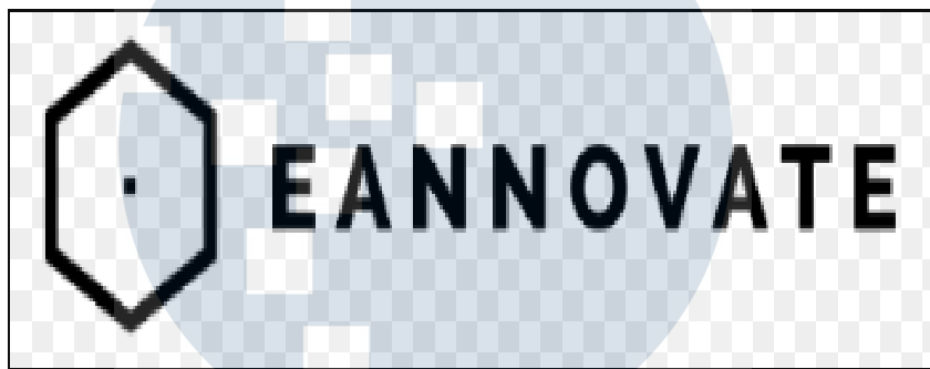
Gambar 2.1 Logo PT Eannovate Creative Technology

Meskipun PT Eannovate Creative Technology masih tergolong perusahaan start up , namun perusahaan ini sudah dipercaya oleh berbagai perusahaan besar untuk menggunakan jasa dari PT Eannovate Creative Technology. Sejumlah brand ternama yang telah menggunakan jasa dari PT Eannovate Creative Technology, di antaranya Soyjoy, Ilitho, SCBD, Instaprint.