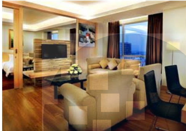
Gambar 2.2 Presidential Suite