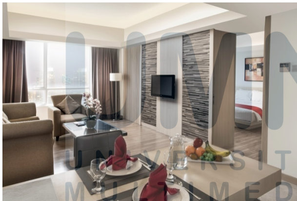
Gambar 2.5 Junior Suite

Jumlah keseluruhan dari tipe kamar ini adalah 6 kamar, yang terbagi menjadi masing-masing 3 kamar untuk Junior Suite Twin dan Junior Suite King.