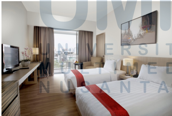
Gambar 2.3 Executive Room

Jumlah keseluruhan dari tipe kamar ini adalah 8 kamar, yang terbagi menjadi 4 kamar Executive Twin dan sisanya Executive King.