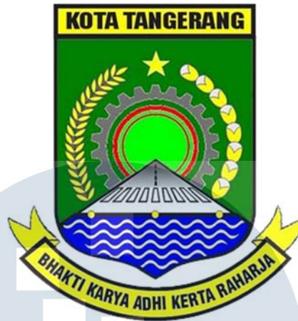
Gambar 2.1 Logo Kota Tangerang

Lambang daerah berbentuk perisai dengan warna hijau Motto "BHAKTI KARYA ADHI KERTARAHARJA", artinya adalah semangat pengabdian dalam bentuk karya pembangunan untuk kebesaran negeri dan kemakmuran serta kesejahteraan wilayah. Didalam lambang tersebut terdapat lukisan-lukisan yang merupakan unsur-unsur sebagai berikut: