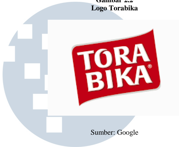
Gambar 2.2 Logo Torabika

Hingga saat ini, Perseroan tetap konsisten pada kegiatan utamanya, yaitu di bidang pengolahan makanan dan minuman. Sesuai dengan tujuannya, Perseroan bertekad akan terus menerus berupaya meningkatkan segala cara dan upaya untuk mencapai hasil yang terbaik.