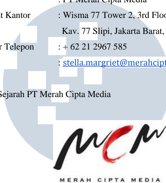
Gambar 2.1 Logo PT Merah Cipta Media

PT Merah Cipta Media atau Merah Cipta Media (MCM) Group adalah perusahaan dengan solusi lengkap di bidang pemasaran, komunikasi, branding, dan digital media untuk industri besar di Indonesia. Berawal pada 2001 di Chicago, Amerika Serikat sebagai digital marketing agensi, dan tahun 2003 MCM kembali menetap di Jakarta, Indonesia.