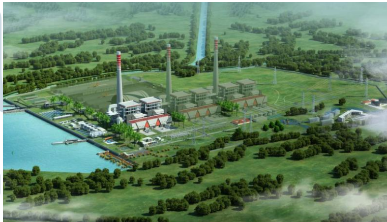
Gambar 2.3 PLTU Jawa 7

PLTU Jawa 7 berlokasi di Desa Terate, Kecamatan Kramatwatu, Kabupaten Serang, Provinsi Banten dan merupakan bagian dari proyek mega listrik 35.000 MW.