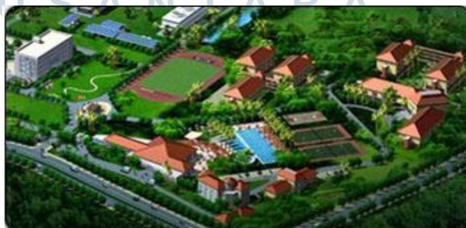
Gambar 2.2 PLTU Simpang Belimbing

Pembangkit listrik dari PT GH EMM Indonesia adalah PLTU Mulut Tambang Simpang Belimbing, mempekerjakan 900 orang tenaga kerja Indonesia, mendukung pembangunan ekonomi dan pekerjaan sosial. Selain itu, proyek ini merupakan bagian dari proyek listrik 35.000 Watt.