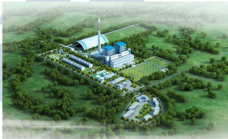
Gambar 2.4 PLTU Sumsel-1

Selama masa konstruksi, proyek ini akan menciptakan sekitar 3.000 lapangan pekerjaan untuk masyarakat lokal. Proyek ini diprediksi dapat berkontribusi memberikan 10 juta dolar pajak bagi Indonesia.