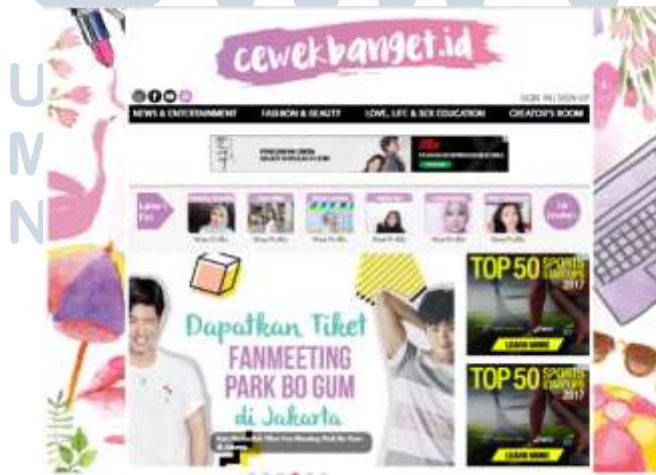
GAMBAR 2.2 TAMPILAN WEBSITE WWW.CEWEKBANGET.ID

Tidak hanya itu, dari segi konten, CewekBanget tidak hanya berfokus seputar kecantikan atau gosip selebriti saja, tetapi juga mengenai isu yang kerap dialami remaja putri seperti misalnya menstruasi, pengetahuan seks, persahabatan dan isu-isu pemberdayaan perempuan lainnya. Dari segi tampilan, CewekBanget.id unggul dengan tampilan dan visualnya yang ceria dan lebih berwarna. Cewekbanget.id juga mulai memvisualisasikan kontennya ke dalam bentuk video yang diunggah di 'Youtube' setiap Senin. Hal inilah yang membuat website cewekbanget.id unggul dibandingkan dengan website kompetitornya seperti gadis.co.id atau gogirlmagz.com . Hal ini terlihat dari peringkat pada website www.alexacom , cewekbanget.com menduduki peringkat 1.864 di Indonesia sementara gadis.co.id berada di peringkat 6.719 dan gogirlmagz.com di peringkat 12.044.