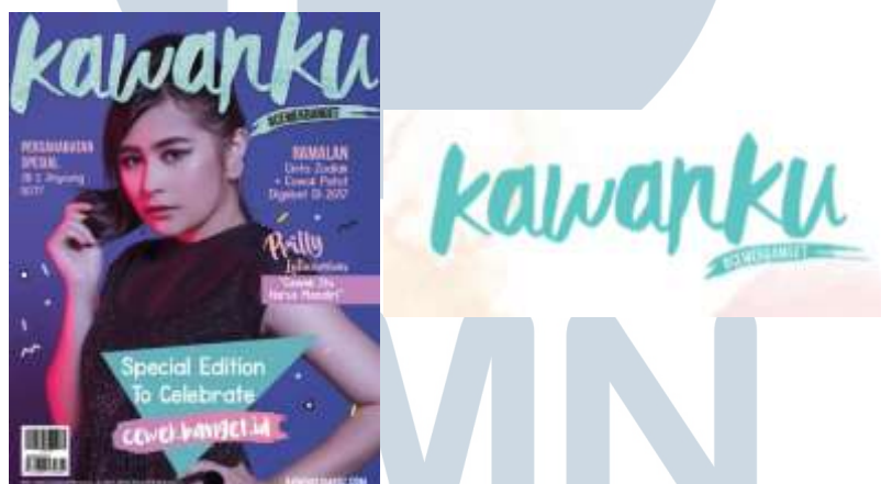
GAMBAR 2.1 SAMPUL MAJALAH DAN LOGO KAWANKU

Untuk menandai pergantian segmentasi pembaca ini, maka Kawanku mengganti taglinenya menjadi ‘Paling Tahu yang Cewek Mau’ yang kemudian berganti lagi menjadi ‘ Unbeatable Fun Girl ’, dengan ikon monyet berwarna pink bernama onyit. Pada tahun 2016, Kawanku mengganti tagline mereka menjadi #cewekbanget yang mempunyai tujuan untuk mengubah stigma dari frasa ‘cewek banget’ yang dinilai tidak keren dan diidentikan dengan remaja perempuan yang hanya memikirkan fashion, make up , dan menyukai warna merah muda menjadi sebuah frasa yang menunjukkan bahwa ‘cewek banget’ tidak hanya itu saja, tetapi remaja perempuan yang mandiri, kuat, dan pintar juga ‘cewek banget’. Tagline ini diharapkan dapat memberikan suatu pemahaman baru bagi para remaja perempuan untuk tetap bangga menjadi perempuan dan bisa menjadi versi terbaik dari dirinya.