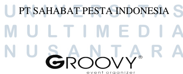
Gambar 1.1 Logo PT Sahabat Pesta Indonesia