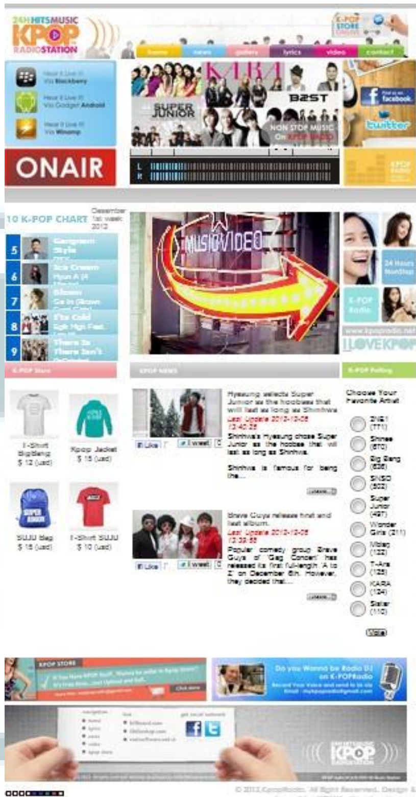
Gambar 2.3 Tampilan Website KPOPradio