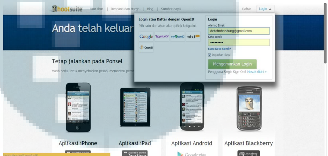
Gambar 3.1 Tampilan Hootsuite.com

Setelah itu, penulis akan memasukkan info yang sudah dibuatnya dan menjadwalkan kapan info itu akan muncul,serta memasukkan gambar apabila diperlukan.