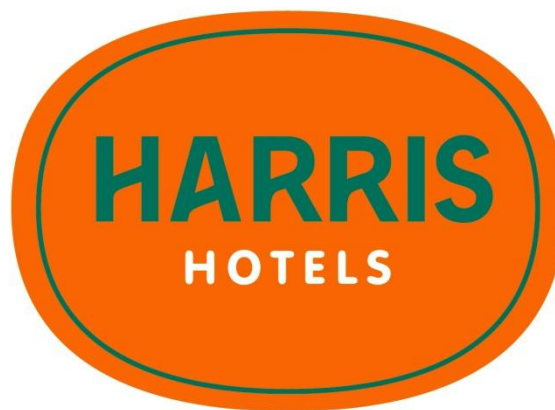
Gambar 2.1 Logo HARRIS

Seperti yang dapat kita lihat, HARRIS Hotel & Conventions Kelapa Gading memiliki dua warna utama yakni warna Jingga atau Orange dan Hijau. Kedua warna yang menjadi warna utama tersebut terinspirasi dari dua buah yaitu buah jeruk dan buah apel. Kedua buah tersebut memiliki peran penting dalam konsep dan moto HARRIS Hotel & Conventions Kelapa Gading yaitu sebagai berikut.