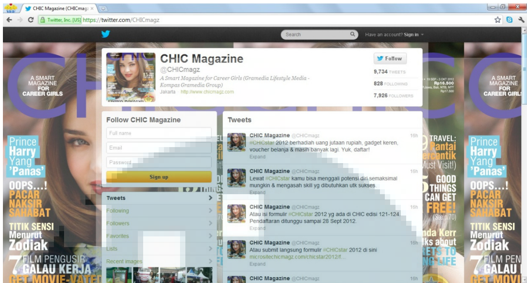
Gambar 2.5 Tampilan Twitter Majalah CHIC