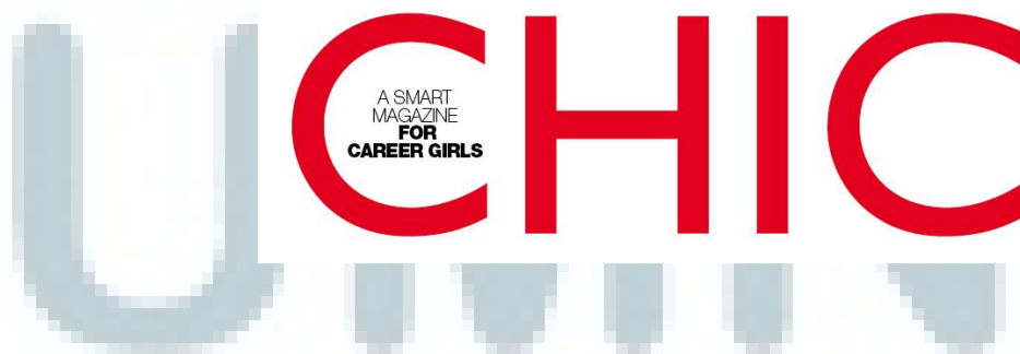
Tampilan Logo Majalah CHIC