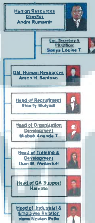
Bagan 2.2.2. Struktur Organisasi Divisi HRD Matahari Department Store

Fungsi Public Relations pada PT Matahari Department Store Tbk berada di bawah dua divisi, yaitu Human Resources Department dan Corporate Secretary & Legal Department . Namun secara teknik, keduanya memiliki fungsi PR yang berbeda. Fungsi PR yang dilaksanakan di bawah divisi Human Resources Department , dipegang oleh seorang Public Relations Officer yang berperan dalam menjalankan aktivitas PR mencakup: Corporate Social Responsibility (CSR) dan Media Relations . Di mana fungsi media relations diterapkan dalam melaksanakan berbagai kegiatan penting yang berhubungan dengan pers antara lain dalam rangka pembukaan gerai baru Matahari Department Store dan launching program CSR ataupun program lainnya. Berikut penempatan fungsi Public Relations pada struktur organisasi dalam divisi Human Resources Department PT Matahari Department Store Tbk: