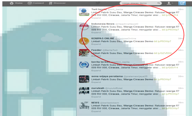
Gambar 3.1 Social media monitoring dalam Twitter

Terdapat beberapa poin penting yang harus diperhatikan dalam melakukan media monitoring antara lain keyword yang tepat, media yang memberitakan, tanggal pemberitaan, dan tone dari pemberitaan tersebut. Berikut ini salah satu contoh online media monitoring yang dilakukan oleh penulis: