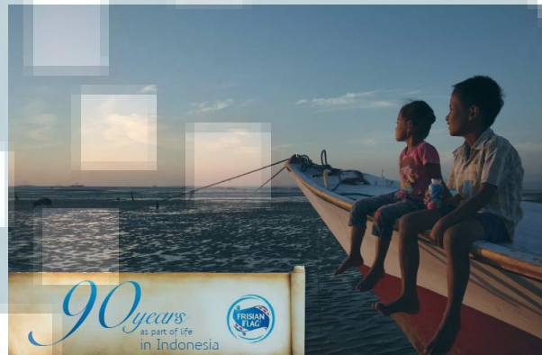
Gambar 3.3 Cover depan coffee table book Frisian Flag 90 Years

Dalam coffee table book Frisian Flag 90 Years ini menceritakan pelopor dari kehadiran susu Frisian Flag di Indonesia, perjalanan susu Frisian Flag selama 90 tahun, kebaikan nutrisi dari susu Frisian Flag, rangkaian proses produksi susu Frisian Flag, sistem pembuangan limbah susu Frisian Flag, karyawan dari Frisian Flag Indonesia, produk terbaru dari Frisian Flag, penghargaan yang diperoleh Frisian Flag Indonesia, program CSR Frisian Flag Indonesia, dan menceritakan kehidupan dari berbagai lapisan masyarakat Indonesia bersama susu Frisian Flag.