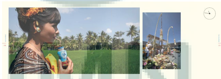
Gambar 3.5 Setting dan layout coffee table book FF 90

Dan juga mewawancara narasumber dan membuat transkrip wawancara beserta artikel untuk content coffee table book Frisian Flag 90 Years. Coffee table book Frisian Flag 90 Years finalisasi pada 31 Agustus 2012 dan siap naik cetak.