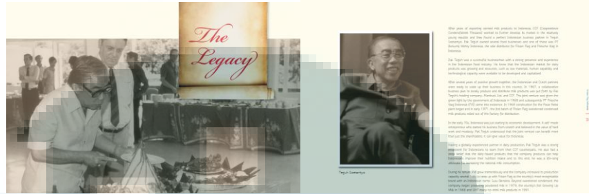
Gambar 3.6 Setting dan layout coffee table book FF 90

Coffee table book Frisian Flag 90 Years hanya dibagikan ke beberapa stakeholders seperti Managing Director, BOD, Manager, beberapa distributor, dan pedagang susu Frisian Flag di seluruh Indonesia yang terpilih. Dalam hal ini, penulis bertugas dalam mendistribusikan coffee table book Frisian Flag 90 Years ke beberapa BOD dan berbagai pihak yang telah menjadi bagian dari kesuksesan susu Frisian Flag di Indonesia.