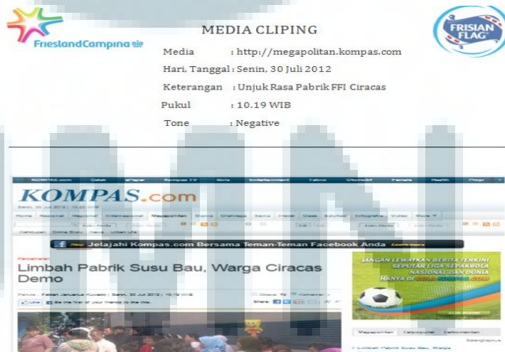
Gambar 3.2 Online media monitoring

Terdapat beberapa poin penting yang harus diperhatikan dalam melakukan media monitoring antara lain keyword yang tepat, media yang memberitakan, tanggal pemberitaan, dan tone dari pemberitaan tersebut. Berikut ini salah satu contoh online media monitoring yang dilakukan oleh penulis: