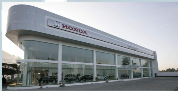
Gambar 2.2 Dealer Honda Trimegah BSD

PT Trimegah Auto Plaza merupakan salah satu dealer yang diresmikan oleh PT Honda Prospect Motor pada 24 April 2009. PT Trimegah Auto Plaza yang juga dikenal dengan nama Honda Trimegah BSD didirikan di area seluas 3833 meter persegi dan berlokasi di Jalan Pahlawan Seribu CBD Lot VIII No. 1 Bumi Serpong Damai, Tangerang. Honda Trimegah BSD merupakan dealer Honda resmi dengan sarana penjualan ( showroom ), bengkel ( service ), serta suku cadang ( spare parts ).