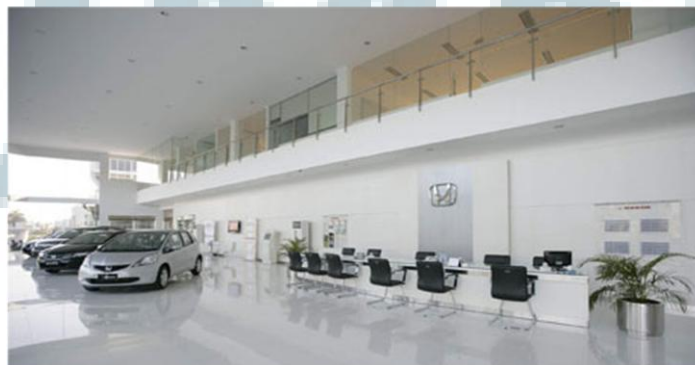
Gambar 2.3 Showroom Honda Trimegah BSD

Honda Trimegah BSD mempunyai tujuan untuk menjadi dealer Honda favorit sehingga sangat mengutamakan pelayanan terhadap customer . Selain itu, Honda Trimegah BSD juga akan terus memberikan pelatihan kepada karyawan sehingga akan menciptakan kepuasan pelanggan yang maksimal.