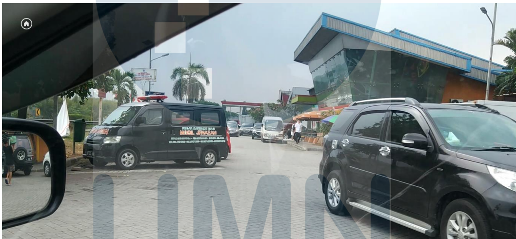
Gambar 1. 9 Tempat Parkir Mobil Pribadi di Rest Area KM 45 arah Merak - Tangerang