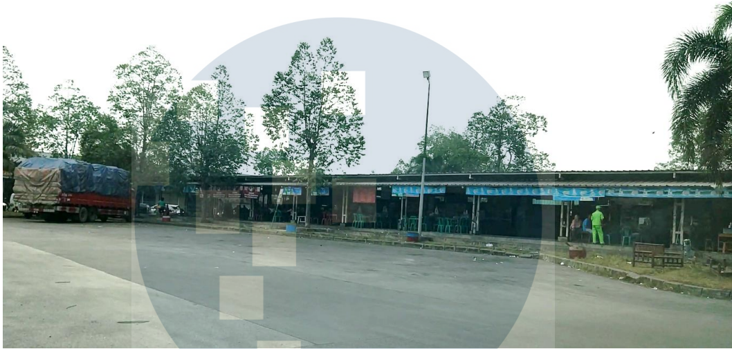
Gambar 1. 6 Pujasera Rest Area KM 43 arah Tangerang - Merak

Namun sayangnya, Rest Area yang dimiliki PT Marga Mandalasakti tepatnya di jalan tol Tangerang – Merak, bisa dibilang sepi pengunjung meski traffic pengguna layanan jalan tol ini meningkat. Rest Area nya pun kurang marka jalan dan petunjuk arah. Berikut beberapa foto bukti sepiinya (sepi pengunjung mobil pribadi) dan kurangnya marka jalan ke empat Rest Area tersebut.