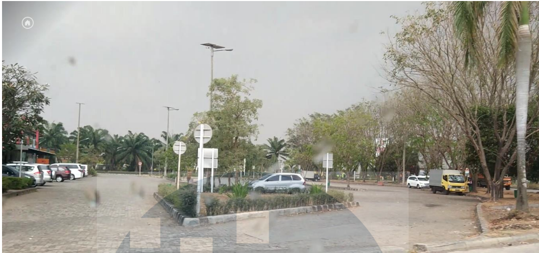
Gambar 1. 8 Tempat Parkir Mobil Pribadi di Rest Area KM 68 arah Merak - Tangerang