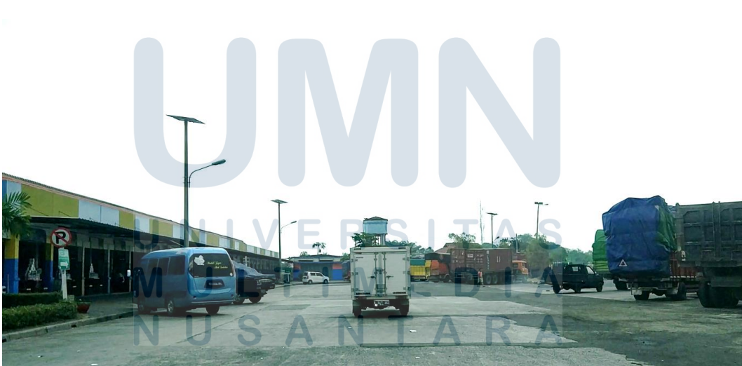
Gambar 1. 7 Pujasera Rest Area KM 68 arah Tangerang - Merak