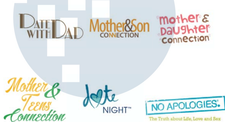
Gambar 2.3 Program Pelayanan FOFI

dan sedikit terdapat banyak lubang yang menandakan bahwa menjalani kehidupan keluarga memang tidak mudah namun visi bagi keluarga tetap konstan, seperti yang digambarkan dalam ketajaman siluet keluarga. Penggunaan warna di logo ini adalah mengkombinasikan warna turquoise dan biru untuk mencerminkan kehidupan. Jenis huruf yang klasik dan tidak sulit untuk diingat guna untuk memperkuat kesan dikenali dan akrab. Huruf “O” dan “C” saling terkait untuk melambangkan kedekatan dan keterikatan yang tidak mengenal tanda putus antar anggota keluarga sampai maut yang memisahkan