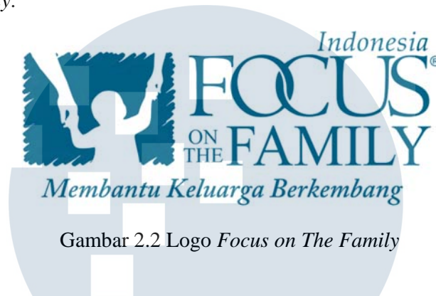
Gambar 2.2 Logo Focus on The Family

Logo Focus on The Family Indonesia ini sudah melakukan re-branding dari logo sebelumnya. Re-branding logo dilakukan pada Focus on the Family Colorado yang disosialisasikan dan digunakan oleh seluruh cabang Focus on The family .