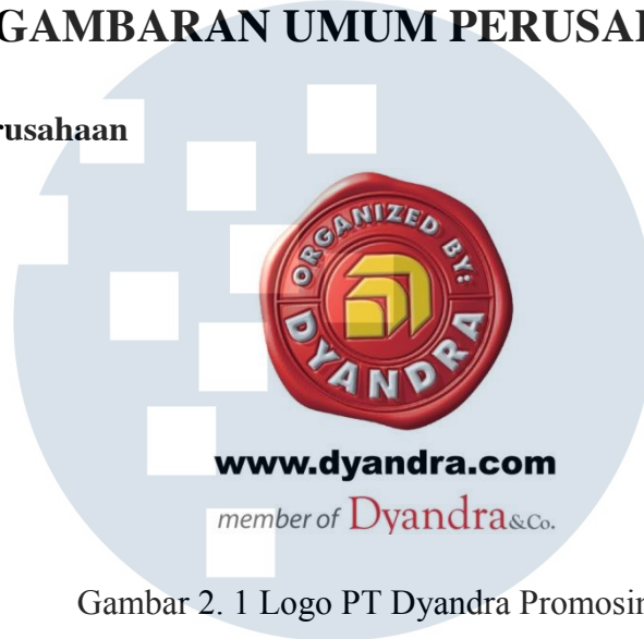
Gambar 2. 1 Logo PT Dyandra Promosindo

PT Dyandra Promosindo merupakan professional exhibition organizer terkemuka di Indonesia yang berdiri sejak 1994. Selama bertahun-tahun, PT Dyandra Promosindo telah menghasilkan rekam jejak yang baik dalam penyelenggaraan acara-acara nasional.