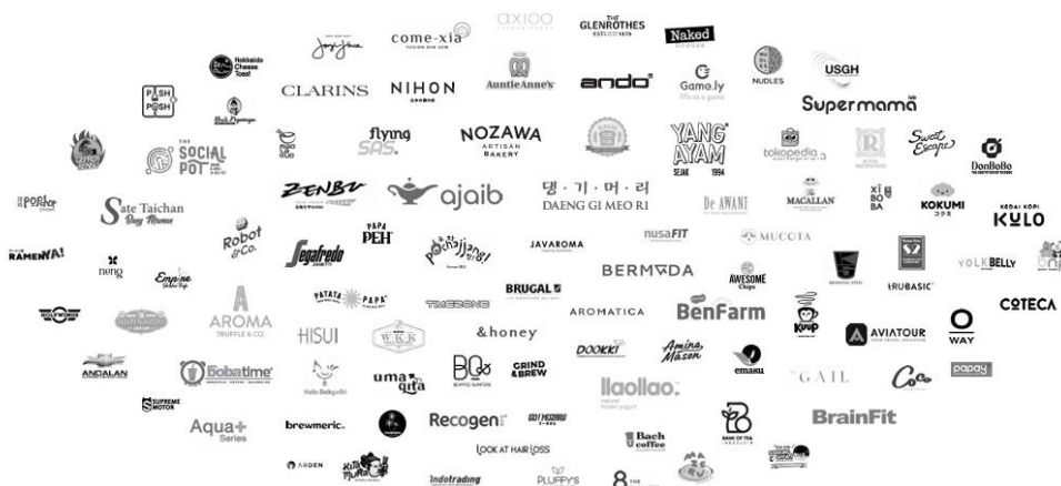
Gambar 2.2 Patners Brand PT.Idein Kreatif Indonesia

Sejak awal didirikan hingga saat ini, PT. Idein Kreatif Indonesia sudah menjalin kerja sama lebih dari 50 (lima puluh) klien dengan berbagai brand terkenal. Adapun beberapa klien tersebut memiliki nama merek dagang terkenal yang terpasang di platform media sosial seperti instagram, facebook, youtube, dan tiktok. Pada saat ini, mulai Januari tahun 2024 PT. Idein Kreatif Indonesia telah menangani 12 klien dalam sektor bidang usaha yang bervariasi. Beberapa sektor usaha yang ditangani adalah sektor fashion & Cosmetics, Home furniture, Health care & product, Food & beverage , dan lain-lain. PT Idein Kreatif Indonesia mempunyai visi untuk memberikan jawaban dan Solusi dari segala kebutuhan bisnis di bidang kreatif (Company Profile Idein, 2023).