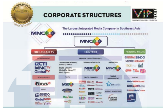
Gambar 2.2 Struktur konvergensi MNC Media