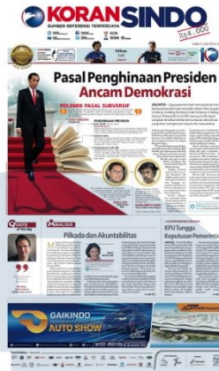
Gambar 2.3 Halaman Utama Koran Sindo