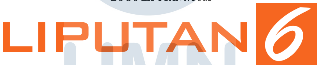
GAMBAR 2.1 LOGO LIPUTAN6.COM

Portal berita ini berisikan berbagai topik dan informasi berupa artikel, berita, agenda acara, dan weblog seperti news , video, bola, health dan lain sebagainya. Liputan6.com memiliki arti lambang. Pada warna orange menggambarkan Semangat, Kreatif, Inspiratif dan menyebarkan hal-hal yang positif. Angka 6 diartikan juga sebagai tanggungjawab dan keseimbangan.