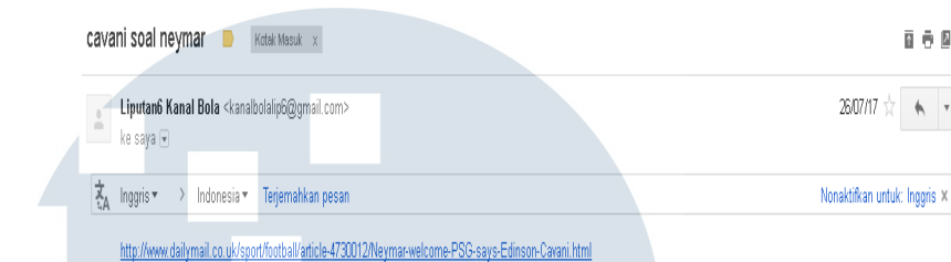
Gambar 3.1 E-mail Pemberian Tugas

yang diterima penulis. E-mail penugasan selanjutnya akan penulis dapatkan setelah penulis menyelesaikan tugas yang pertama diberikan.