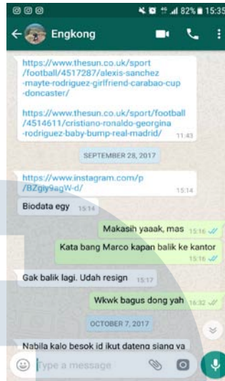
Gambar 3.2 WhatsApp Pemberian Tugas